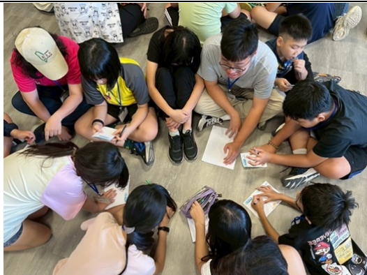
暑假環遊世界英文營