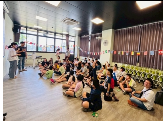
暑假環遊世界英文營