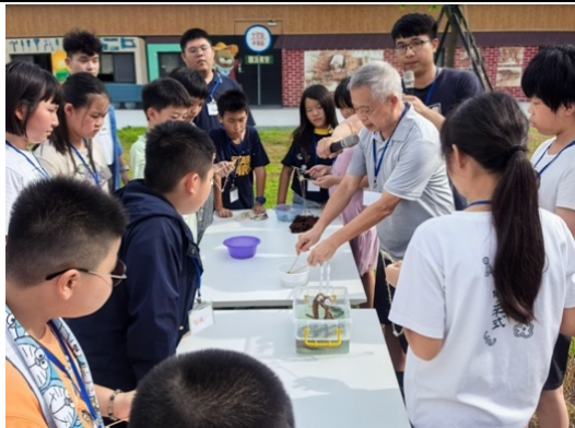
暑假 AI 科學營