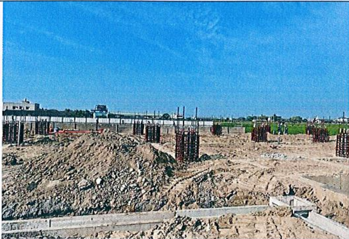
水溝埋設工程、1樓水電配管